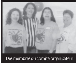
Des membres du comité organisateur