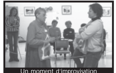
Un moment d'improvisation

En faisant de l'improvisation!!! Il y avait un « ring » au centre de la salle et les femmes étaient assises autour. Les deux équipes étaient formées de deux femmes du comité organisateur et à chaque improvisation, les participantes étaient sollicitées à se joindre à nos équipes. Au total, nous avons fait 7 improvisations, et une dizaine de femmes