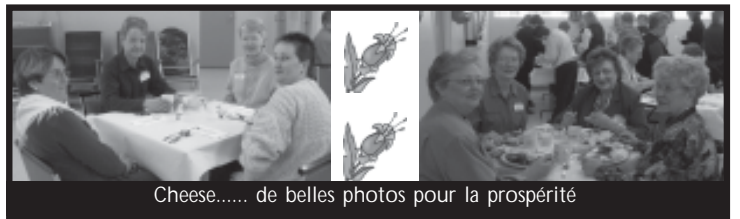
Cheese..... de belles photos pour la prospérité

Merci de votre participation et à l'année prochaine! Audrey