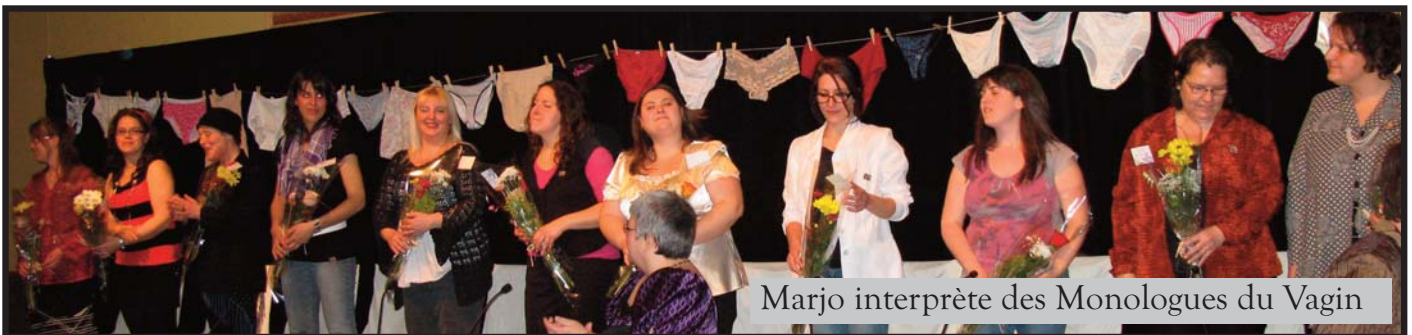
Marjo interprète des Monologues du Vagin